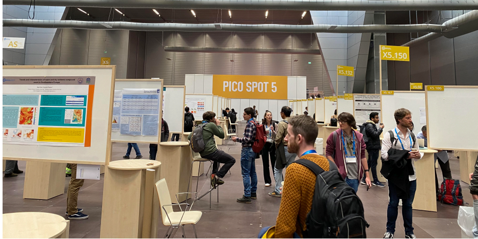
海報區寬敞空間及充足設施